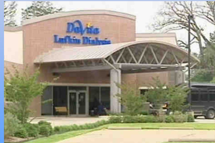
DaVita Dialysis Center